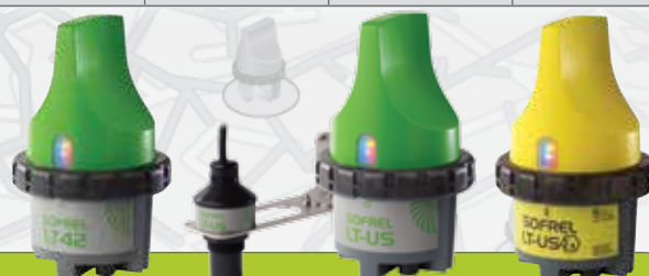
SOFREL LT-42 SOFREL LT-US SOFREL LT-US ATEX