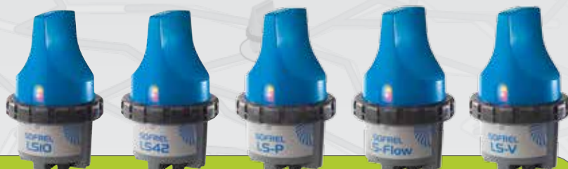
SOFREL LS-10 SOFREL LS-42 SOFREL LS-P SOFREL LS-Flow SOFREL LS-V